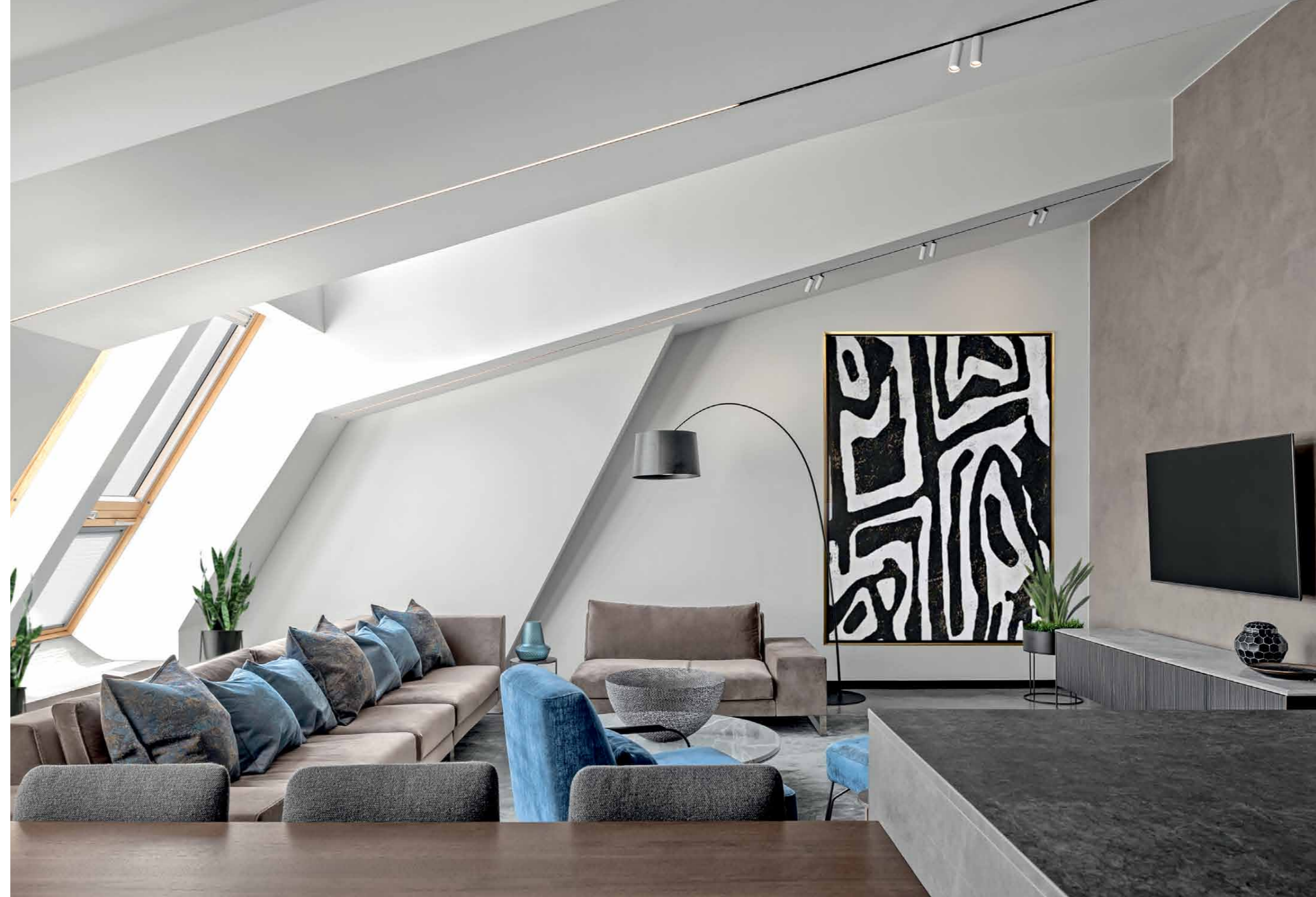
Вид из гостиной на зону кухни. Кухня, Scavolini