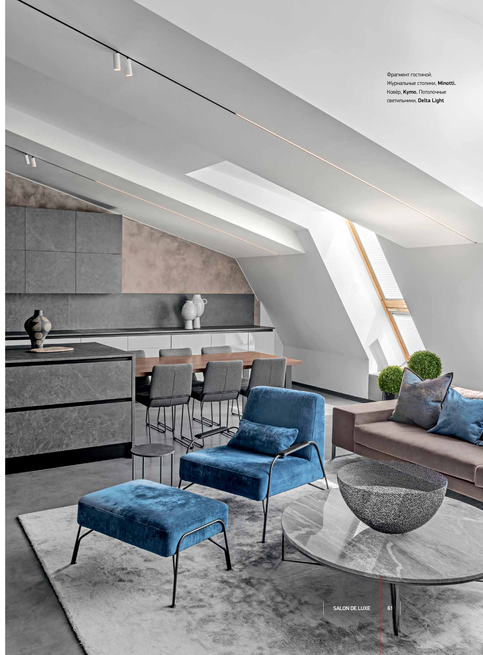
Фрагмент гостиной. Журнальные столики, Minotti. Ковёр, Kumo. Потолочные светильники, Delta Light